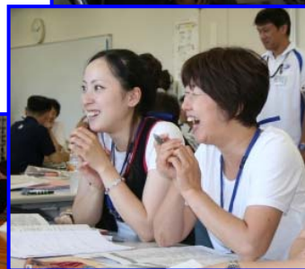
(第二期第二回 8/22) 教室の様子