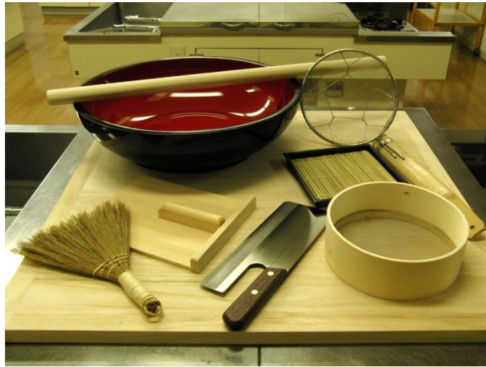
そば打ちセット (全体)